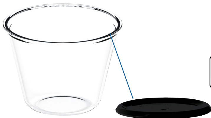
ref : 99P2250NCOV